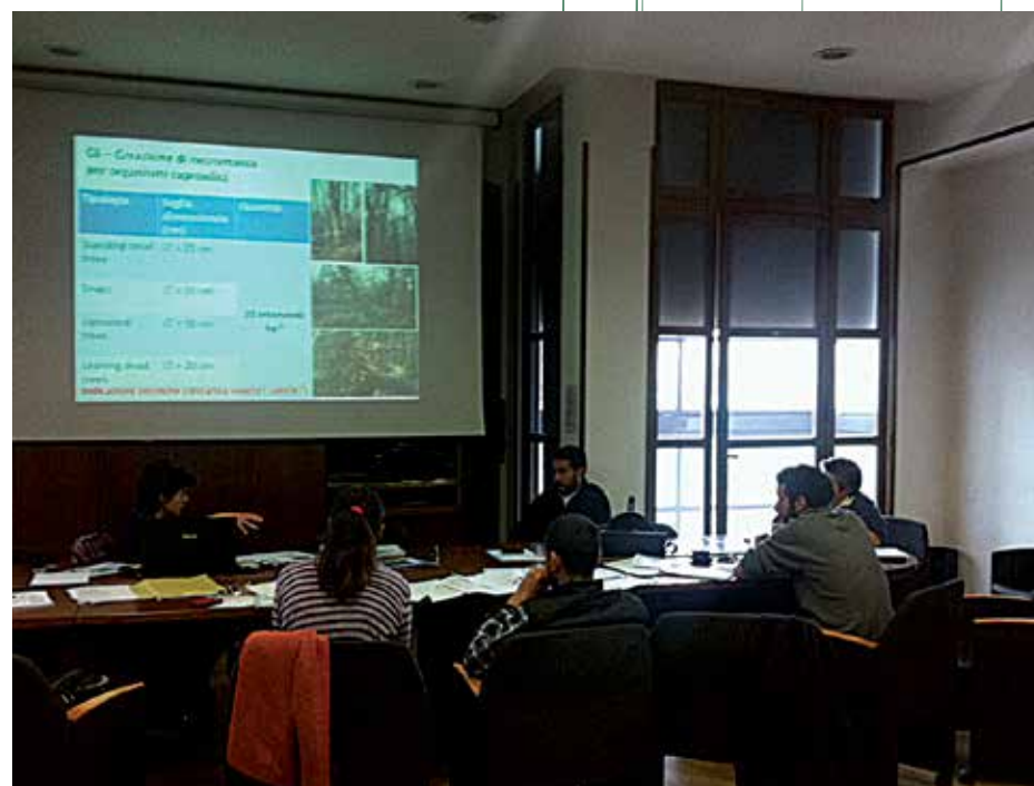
Uno dei vari Incontri finalizzati alla discussione dei progetti preliminari.

La struttura hanno coinvolto vari esperti sia del Dipartimento di Biologia (DBA) della Sapienza Università di Roma che del Dipartimento di Scienze della Terra e dell'Ambiente dell'Università della Tuscia.