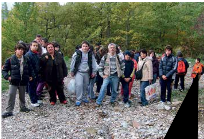
Attività didattiche nel Parco del Cilento: la classe III A di Buonabitacolo (SA).