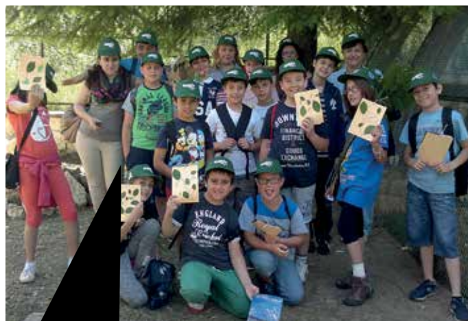
Attività didattiche nel Parco del Gran Sasso: Classe "Fagus Museo".