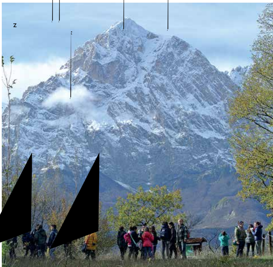
Attività didattiche nel Parco del Gran Sasso: escursione Sentiero Natura San Pietro.

montano: dalle faggete del Voltigno alla Macchia di San Pietro, dal Bosco di Santa