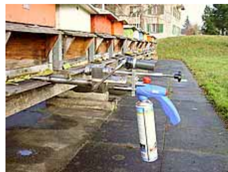
Foto 1: Vaporizzatore a gas di acido ossalico (OSG) di Eduard Fehr

Già nel 2001 e nel 2003 avevamo testato diversi evaporatori di acido ossalico elettrici e a gas (4) . Dalle nostre ricerche è emerso che gli evaporatori elettrici Varrox e Varrex sono molto efficaci nella lotta contro la varroa in colonie prive di covata (95%). Quelli a gas, come Isenring e Krüso, che trasportano l'acido ossalico sublimato sfruttando esclusivamente il calore, sono rispettivamente discretamente o poco efficaci. L'evaporatore a gas Varrogaz, con ventilatore incorporato, ha rivelato un'elevata efficacia comparabile a quella degli evaporatori elettrici.