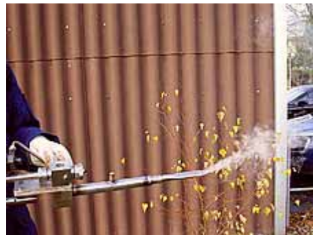
Fig. 2: Forte fuoriuscita dell'acido ossalico sublimato grazie al ventilatore

Per il trattamento comparativo e di controllo è stato utilizzato il Varrox, un evaporatore elettrico (6) . In questo caso il trattamento delle colonie è stato effettuato dal retro dell'arnia, attraverso il cassetto ricoperto da una griglia predisposto per la caduta degli acari della varroa (v. fig. 3).