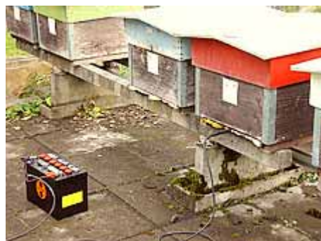
Fig 3: Varrox, evaporatore elettrico di acido ossalico