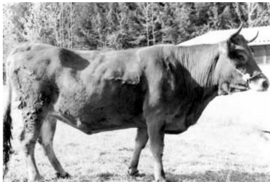
Fig. 1. Soggetto di razza Pontremolese. Pontremolese cow.

Dalle misure da noi rilevate (Tab. II) sembra evidenziarsi un cambiamento del tipo morfologico verso una mole più ridotta rispetto al tipo descritto nel 1935.