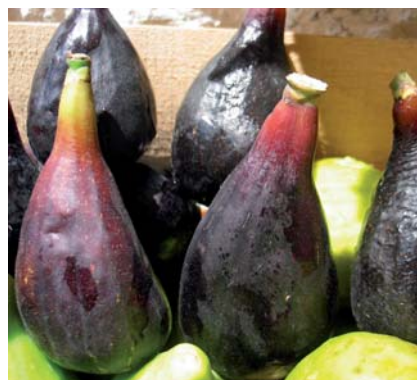
I caratteristici piccoli allungati e legno dei piccioli del Fiorone Menna di Vacca (N. Biscotti)

Tradizione orale, testimonianze scritte [Biscotti N., I frutti antichi del Gargano, in corso di stampa] nessun progetto di tutela e valorizzazione