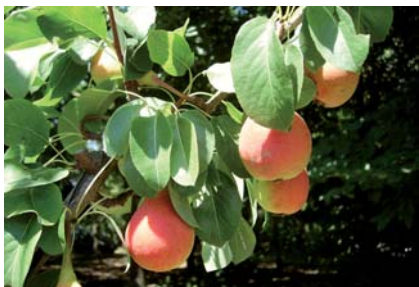
Pera Rampine a maturazione completa (S. Guidi)