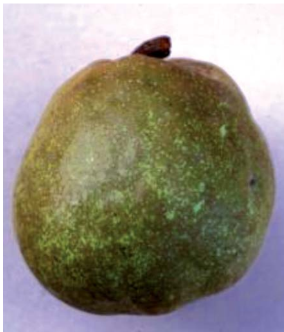
Foto 12: Particolari pomologici della pera invernale Trentatré Once (M. Di Santo)

Referente: Marco di Santo marco.disanto@parcomajella.it