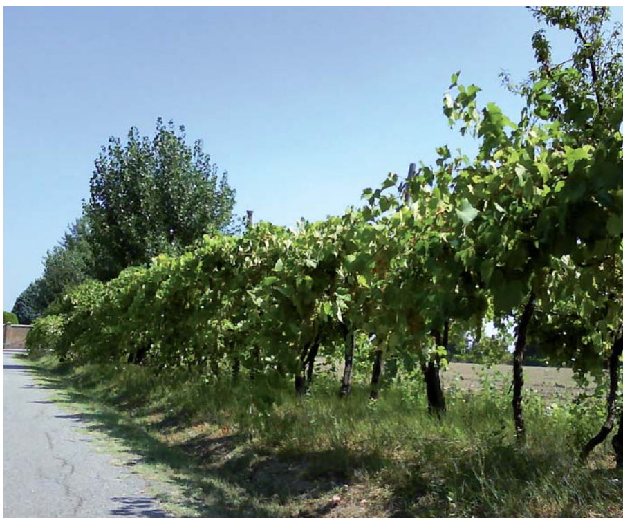
Foto 24: Pergola romagnola di viti centenarie recuperate, fra cui l'Uva Morta e la Caveccia