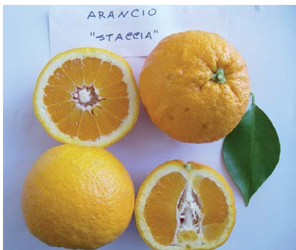
Foto 16: Arancia Staccia (da poster Mennone, Calabrone, Milella, Martelli)