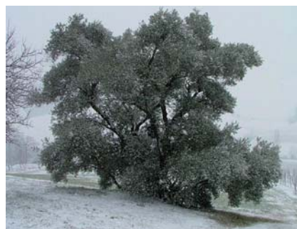
Olivo di Tabiano nel periodo invernale

In antichi testi è segnalata la coltivazione dell'olivo in questa località e nella bassa collina parmense fin dal 1258. La tradizione popolare del luogo vuole che questa pianta vegeti da una antica ceppaia probabilmente risalente a quell'epoca.