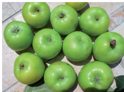
Frutti di Mela di Maggio (N. Biscotti)

Di varietà a buccia "verde" n'esistono oggi appena 37 delle circa 600 che sono segnalate nell'Elenco delle cultivar autotone italiane (CNR, BALDINI et al., 1994). Sono piemontesi, del Trentino Alto Adige, Emiliane. nessuna invece dell'Italia Centro-meridionale. Per la mela di Maggio del Gargano, nessuna attenzione di tutela.