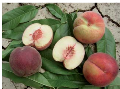
Caratteristica polpa bianca della Bella di Cesena (S. Guidi)

Questo frutto era diffuso in passato in Romagna, ma visto che non si prestava alla commercializzazione per la sua delicatezza è stato abbandonato. Oggi restano alberi sparsi vicino alle case coloniche coltivati a scopo amatoriale e per il consumo dell'agricoltore.