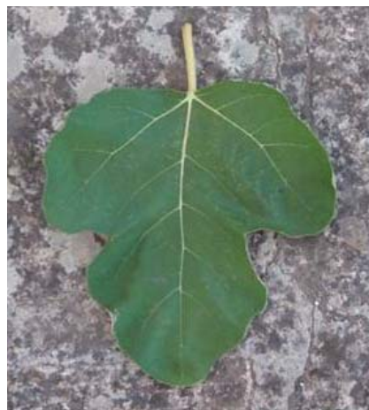
Particolare foglia del Fico Ricotta (P. Belloni)

Paolo Belloni, Associazione La Pomona onlus Cisternino (BR) [pomona@tin.it].