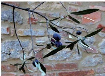
Frutti dell'Olivo Cortigiana [E. Caruso]