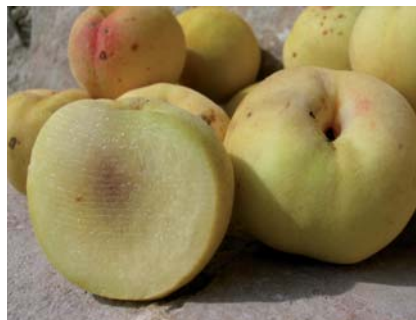
Sezione longitudinale che evidenzia grana e colorazione della polpa (N. Biscotti).

Tradizione orale. In letteratura storica, si parla di due varietà tipiche della Puglia: Percoca bianca di luglio, Percoca striata di settembre (Pantaneli, 1934), entrambe diverse dal tipo in esame. Nessuna attenzione di tutela.