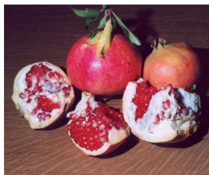
Melograno Grossa di Faenza coi grandi semi (S. Guidi)

In Romagna il melograno era quasi sempre presente nelle aziende agricole e veniva di solito piantato vicino alle case. Oltre al valore simbolico (rappresenta la fertilità), il frutto del melograno era spesso utilizzato al posto del limone nelle insalate e sulle carni. Anche l'Artusi consigliava in cucina il melograno e alcune sue ricette ne fanno riferimento come i "cefali in gratella al melograno".