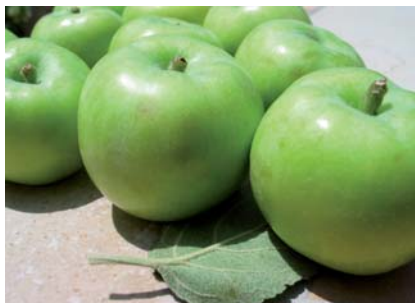
I caratteri peculiari (colore della buccia, forma) della Mela di Maggio (N. Biscotti)