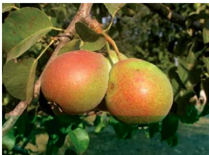
Il Pero Zammarrino in fruttificazione