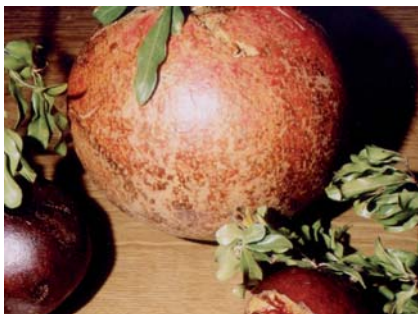
Confronto delle dimensioni con altra varietà (S. Guidi)