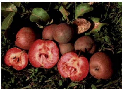
Pera Cocomerina tardiva a completa maturazione (S. Guidi)