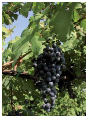
Grappoli di uva della Vite di Roteglia (S. Guidi)