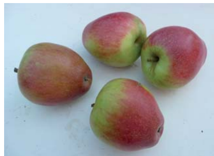
Frutti in fase di conservazione avanzata

Cultivar che andrebbe conservata per il suo germoplasma ma dato l'aspetto curioso dei frutti, potrebbe avere buone possibilità di mercato come prodotto locale, biologico.