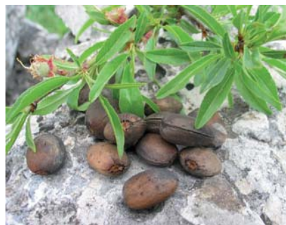
Particolari di foglie, frutticini e frutti di Prunus webbii Spach. (N. Biscotti)

Tradizione orale, testimonianze scritte (Nuovi rinvenimenti di Prunus webbii (Spach) vierh. In Puglia di Piero Medagli et al., 2004, Dipartimento di Scienze e Tecnologie Biologiche e Ambientali Università di Lecce; Botanica del Gargano, di Biscotti N., 2002, Gerni editori, San Severo (FG).