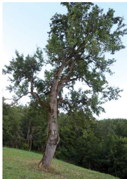
Pero Ravignano secolare (S. Guidi)

I peri isolati in mezzo ai campi avevano anche la funzione di offrire l'ombra sotto la quale consumare la colazione durante i lavori estivi di mietitura e fienagione.