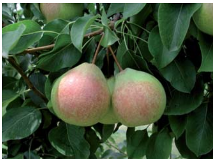
Frutti ormai maturi, prossimi alla raccolta (V. Ancarani)