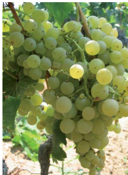
Uva degli Sciali, reperto fotografato negli arenili di Peschici (N. Biscotti)

Nello Biscotti, Vico del Gargano (FG) (nellobiscotti@fastwebnet.it)