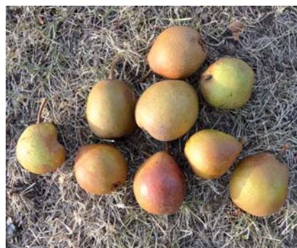
La caratteristica colorazione ruggine dei frutti (S. Guidi)

Non si hanno informazioni a riguardo. Sarebbe interessante approfondire gli studi per capire i motivi di diffusione in un areale così ristretto.