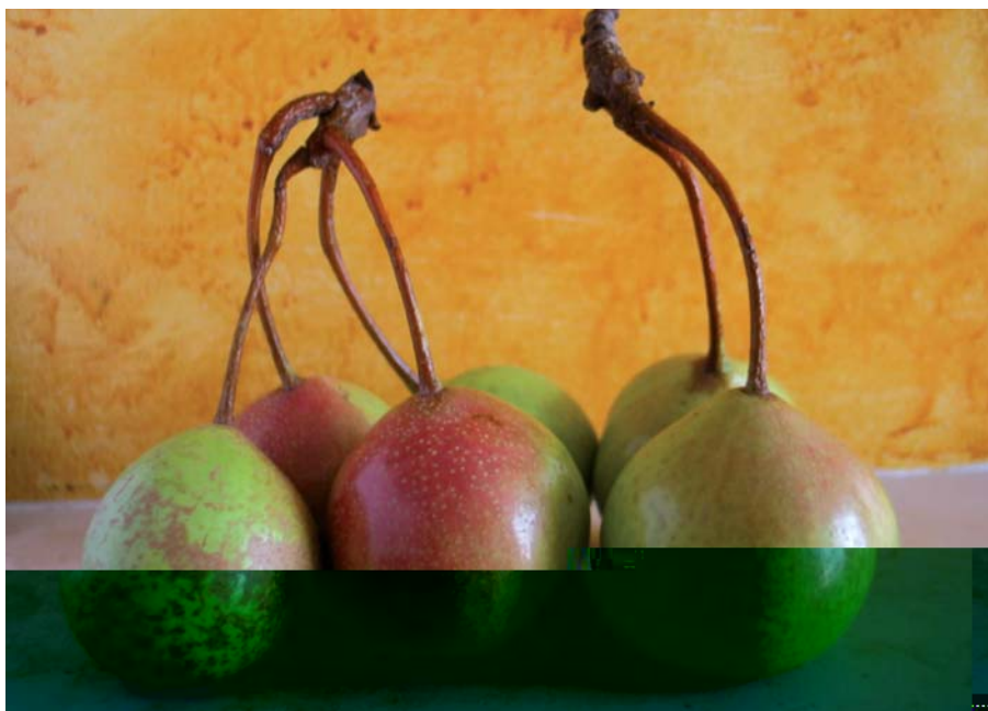
Foto 30: Pera Mezzorotolo (a forma di ruota), nel Gargano, destinato all'essiccazione

zata non solo sui mercati locali ma anche su taluni nazionali", fanno ormai storia. Oggi ci sono ancora i vecchi alberi, ma da tempo, per queste peraglie, non v'è più mercato se non per qualcuna (Pera d'Ischitella) e solo a livello di mercati comunali. La presenza di numerosi alberi attesta la particolare diffusione che questa specie ha avuto nel Gargano. Ogni perastro ( Pyrus amygdaliformis ) è diventato, con l'innesto, un pero, uno per ogni tempo, uno per ogni luogo, da quello dei tratturi a quello di solitarie masserie, a quello che sbuca in mezzo al campo di grano, ancora più prezioso perché, oltre al frutto, determina ombra e frescura per le brevi pause del mietitore (Pera Pagghjionica). Il ruolo del frutto non si esauriva nei soli mesi estivi: tante varietà erano destinate all'essiccazione per poi essere passate al forno in modo da ottenere scorte di zuccheri (pere infornate) durante i lunghi inverni.