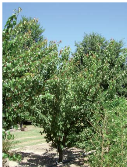
Albero di albicocco in estate (S. Guidi)

In situ : Borgo Tossignano (BO). Si tratta di sole 3-4 piante per cui il rischio di estinzione è tuttora molto elevato. Cultivar a forte rischio di estinzione.