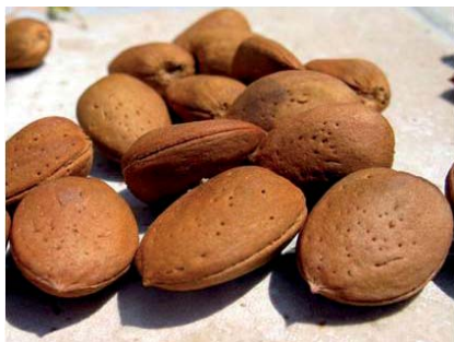
Mandorle di Prunus webbii Spach. (N. Biscotti)