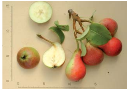
Particolari pomologici della Pera Petrucina (F. Minonne)

Tradizione orale e documentazione storica; rilievi ed osservazioni pomologiche sono state fatte nell'ambito di una tesi di Dottorato (Minonne, 2008). Non è riportata dagli autori pugliesi che si sono occupati di questa specie Donno (1959), Reina (1974), Ferrara (1970); potrebbe essere "nascosta" sotto qualche sinonimia. Progetti di valorizzazione in atto in alcune aziende ortofrutticole del territorio leccese.