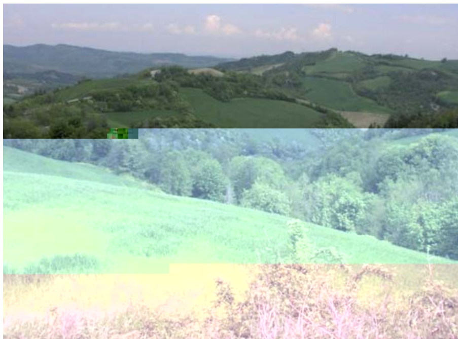
Foto 21: Il paesaggio agrario tradizionale delle colline romagnole (S. Guidi)

La regione Emilia-Romagna ha una grande tradizione agricola e nel settore orto-frutticolo è fra le prime in Europa, non solo sotto l'aspetto produttivo ma anche per la ricerca e il miglioramento genetico. Ciò è stato probabilmente possibile grazie a condizioni pedoclimatiche favorevoli, ma anche per la grande tradizione rurale e la presenza di coltivazioni frutticole che risalgono al passato. Non è un caso che qui si ritrovino i grandi patriarchi fruttiferi che potrebbero aver fornito o potrebbero fornire in futuro il corredo genetico per migliorare le moderne cultivar. La selezione delle nuove varietà fruttifere ha quindi potuto operare su una base genetica molto ampia, utilizzando materiale che negli anni si è adattato all'ambiente e quindi si è mostrato anche più resistente alle avversità. Inoltre occorre ricordare che la prima mostra nazionale dedicata alla frutta si svolse proprio in Emilia-Romagna, a Massalombarda, negli anni successivi alla Prima Guerra Mondiale. Questa cittadina romagnola, in provincia di Ravenna, era considerata la capitale della frutta, in particolare della pesca, sia per la presenza di grandi coltivazioni frutticole sia per le industrie di lavorazione e trasformazione di tali prodotti. Qui è nato un famoso marchio simbolo dei succhi di frutta. Che l'Emilia-Romagna fosse