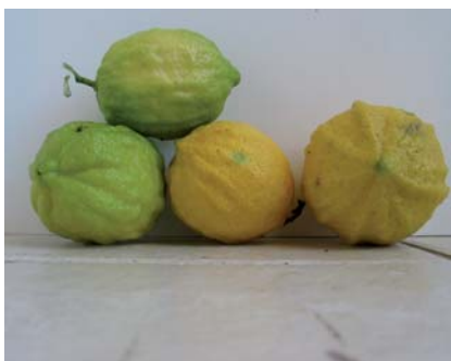
I caratteri peculiari della buccia del Limone Incannellato (N.Biscotti)