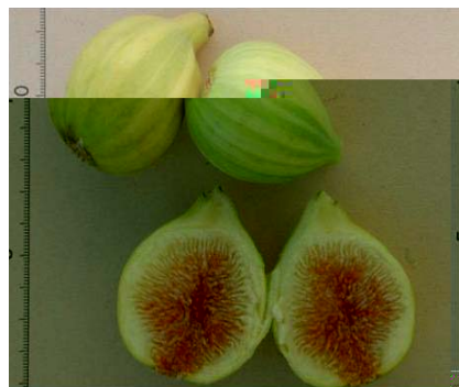
Reperto salentino di Fico Rigato con picciolo corto e di forma subovata (F. Minonne)

Tradizione orale che ne attestano l'antico legame con il Gargano (Biscotti N., I frutti antichi del Gargano, in corso di stampa). Illustrato da Bartolomeo Bimbi (Natura morta, 1696, Palazzo Pitti, Firenze).