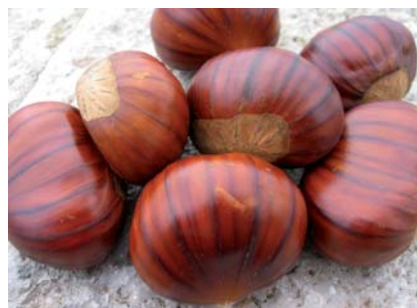
Le caratteristiche striature della Castagna Rigata (N. Biscotti)

Tradizione orale, nessuna attenzione di tutela. Studi in corso (Biscotti, Poster Convegno I Boschi dell'Appennino, Fabriano, 2007; I frutti antichi del Gargano, in corso di stampa).