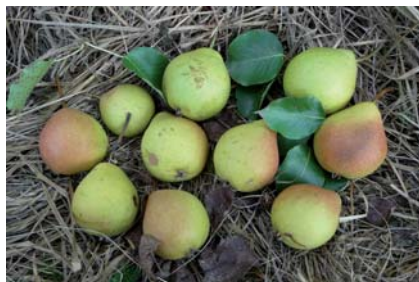
Pera Ravignane a maturazione completa