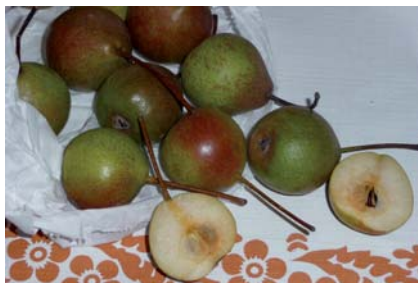
Pera Rusèt a maturazione completa (S. Guidi)