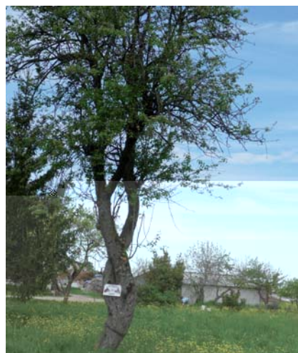
Pianta secolare di Pera delle Garapine (G. Piazzoli)

Di questi frutti si sa poco in quanto sono praticamente sconosciuti come cultivar; essi sono unici per il territorio reggiano e prendono il nome dalla zona chiamata Garapine, situata nella pianura. Il nome sta a indicare antichi prati abbandonati, ormai rari per l'area padana. Secondo alcuni era utilizzato in passato per produrre confetture (i savour in dialetto reggiano).