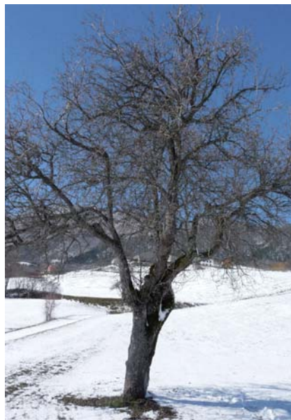
Questo pero è il patriarca di Bobbio

Questo frutto tradizionale delle colline piacentine non si trova in altre province dell'Emilia Romagna e i pochi alberi che si conoscono sono tutti secolari con dimensioni enormi.