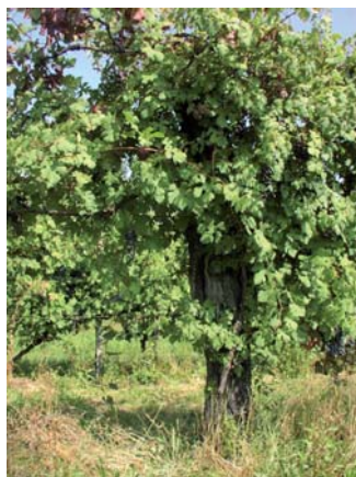
Vite centenaria di Roteglia (S. Guidi)

Non ci sono conoscenze; meriterebbe uno studio del suo DNA per capirne l'esatta origine; l'età secolare che ha raggiunto ci fa capire quanto sia elevata la sua resistenza alle avversità e quindi potrebbe essere impiegato nel miglioramento genetico.