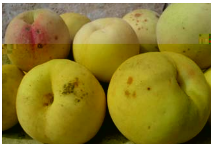
Percoca Bianca in piena maturazione (N. Biscotti)