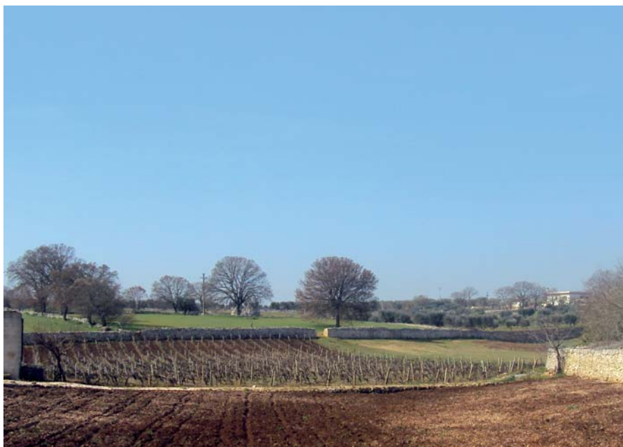
Foto 29: Vigna del Brindisino (Cisternino) allevata ad alberello