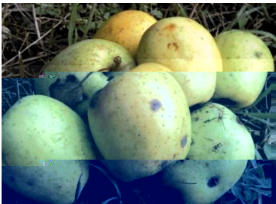
Foto 13: Mele Limoncelle fotografate nei pressi di Campobasso