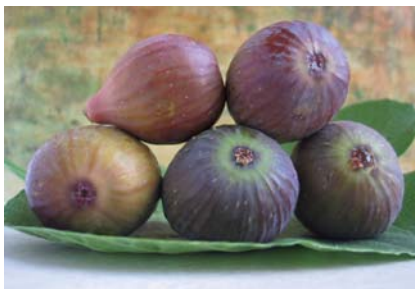
I caratteri peculiari (colore della buccia, forma) del Fico Dottato Nero (N. Biscotti)