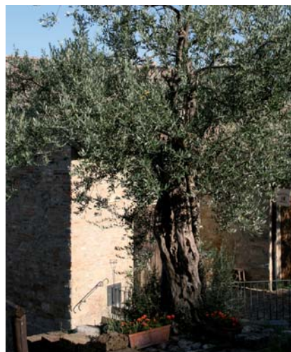
Olivo della Cortigiana di Castrocaro [A. Gulminelli]

Nel XV e XVI sec. l'olivicultura era diffusa nel castrocarese. L'analisi del DNA fogliare non ha evidenziato nessun livello di similarità con altre cultivar catalogate e descritte in Emilia Romagna.