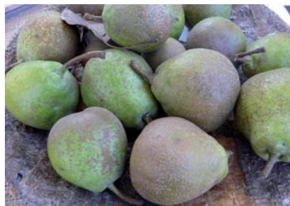
Frutti raccolti a fine ottobre nella zona di Scurano (S. Guidi)

Questo frutto sembra essere unico per il territorio collinare permense, veniva in passato coltivato per l'autoconsumo.