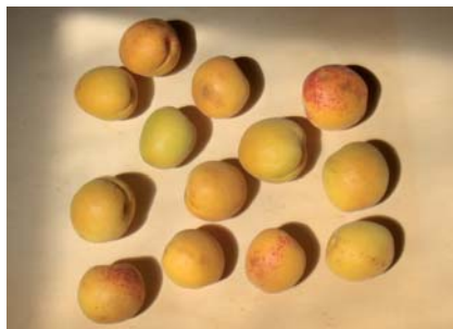
Frutti di Albicocca Tonda di Tossignano (D. Ghetti)