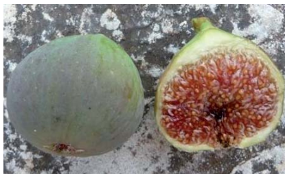
Particolari pomologici del Fico Ricotta (P. Belloni)