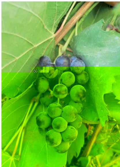
Foto 19: Grappolo di Vitis vinifera sylvestris fotografato in un torrente di Villacidro in Sardegna (N. Biscotti)

affinità genetica per cui è facile dedurre che i vitigni sardi sono il risultato dell'addomesticamento di quelli selvatici. E' dunque una prima testimonianza di nuovi centri d'origine della vite coltivata, aprendo nuovi capitoli a quella consolidata verità storica che lega il processo di addomesticazione della vite alla Mezzaluna fertile. Referente: Nello Biscotti ( nellobiscotti@fastwebnet.it )