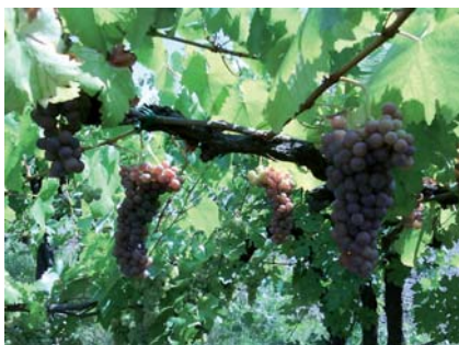
Grappoli di Uva Morta prossimi a maturazione (S. Guidi)