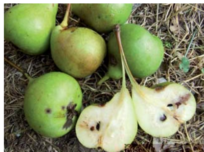
Frutti con polpa succosa

Questo frutto unico per il territorio del Montefeltro, veniva in passato coltivato per l'autoconsumo e destinato alla produzione di ottime marmellate che si consumavano durante tutto l'inverno. I peri erano spesso piantati lungo i filari come tutori vivi delle viti, oppure isolati in mezzo ai campi dove avevano anche la funzione di offrire l'ombra sotto la quale riposare o consumare il pranzo durante i lavori estivi.