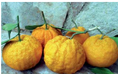
Campioni di Arancia Incannellata nel mese di gennaio (N. Biscotti)