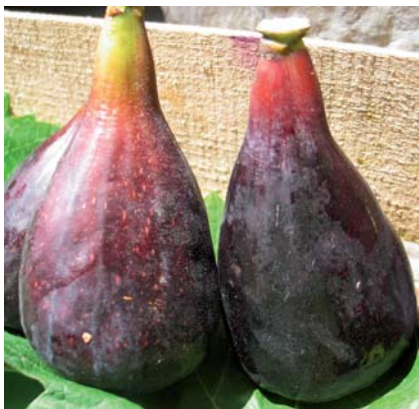
La particolare forma del Fiorone Menna di vacca (N. Biscotti)