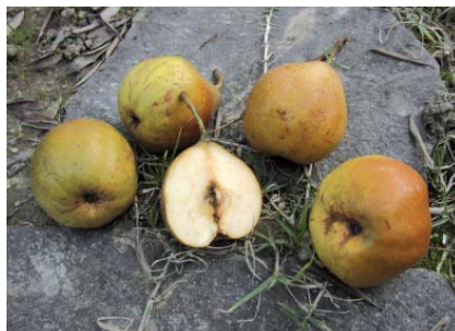
Frutti di Pera Spalèr a maturazione (S. Guidi)