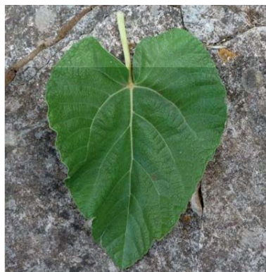
Particolari morfologici della foglia del Fico Ficattala (P. Belloni)

Paolo Belloni, Associazioni La Pomona onlus Cisternino (BR) (pomona@tin.it).