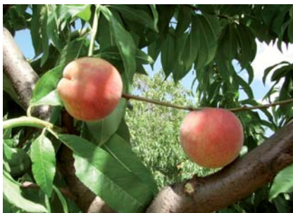
Pesca Bella di Cesena a maturazione (S. Guidi)