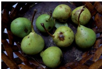
Pera Zucca a completa maturazione (S. Guidi)