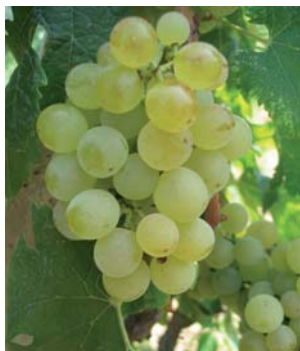
Uva degli Sciali, reperto fotografato negli arenili di Vieste (N. Biscotti)