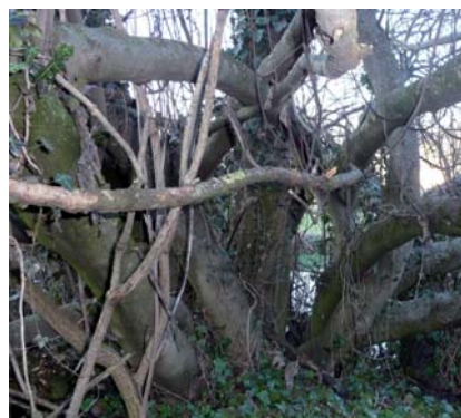
Ceppaia dell'enorme Fico di Cavana

Questa straordinaria pianta meriterebbe di essere studiata sia per conoscerne la varietà, sia per la sua capacità di vegetare praticamente nell'acqua, superando i problemi di asfissia.