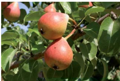
Il Pero Petrucina in fruttificazione (F. Minonne)