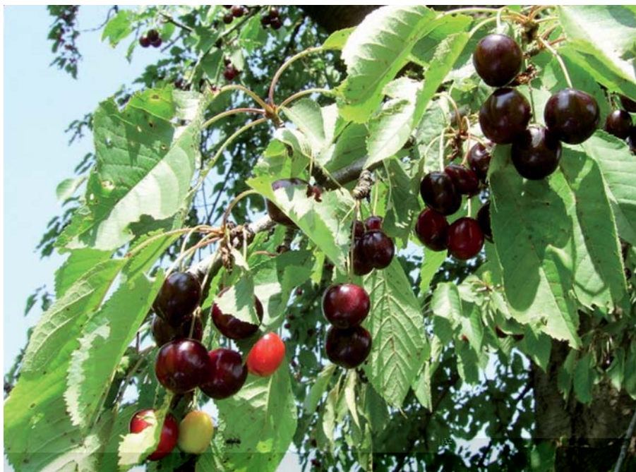
Foto 22: La Ciliegia Morettina di Vignola in piena maturazione (S. Guidi)