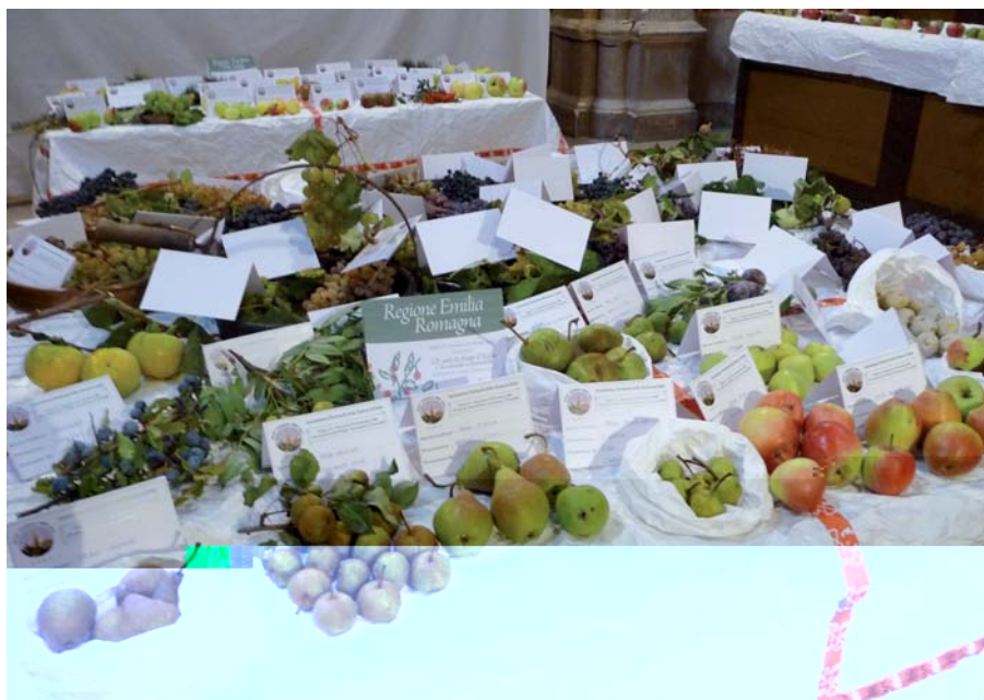
Foto 1: Diversità frutticola delle agricolture promiscue emersa a Pennabilli in occasione della mostra pomologica del 2009

2009) dell'associazione "Patriarchi della Natura" è quella di Pennabilli, in provincia di Rimini, dove è stato possibile raggruppare per la prima volta in Italia, in un unico luogo, i frutti dimenticati a rischio di estinzione e quelli dei più importanti patriarchi fruttiferi. Sono state presentate ben oltre 400 varietà di frutti antichi, semi di cereali e legumi. Per il Mezzogiorno può far testo l'esperienza realizzata in un comune del Brindisino, ove l'"Associazione Pomona" ha realizzato un conservatorio botanico che colleziona diverse decine di varietà di fico.