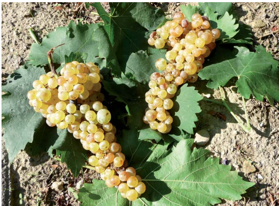
Foto 18: Grappoli con foglie del vitigno Corinto rinvenuto a Belpasso (CT) [S. Guidi]