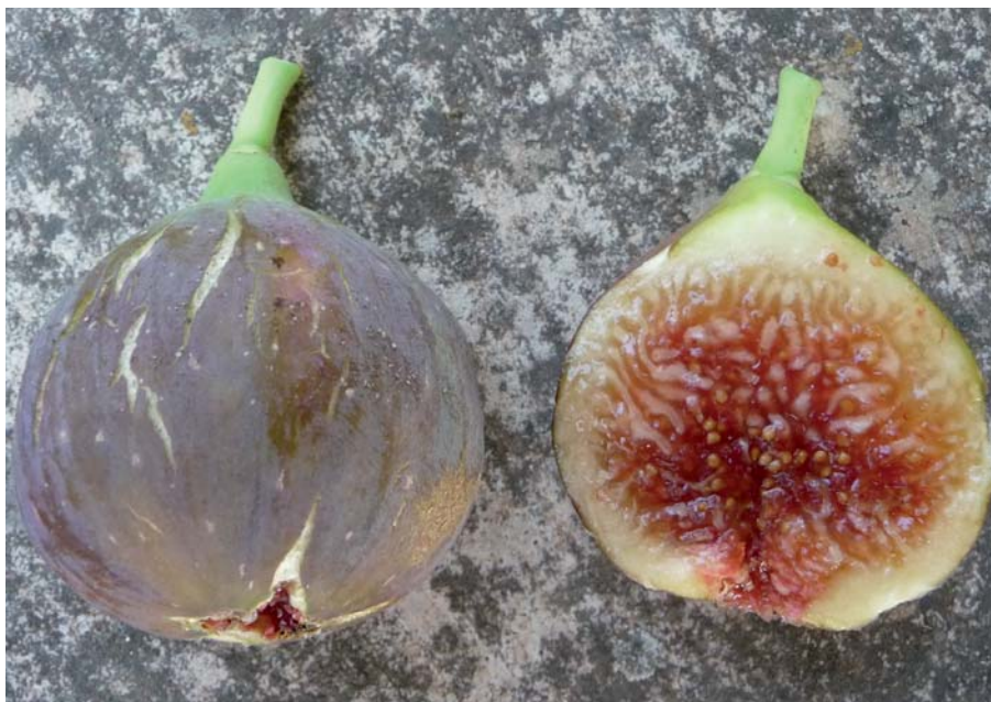
Foto 28: Fico Mattepinta o Tremona del brindisino dal Conservatorio botanico di Cisternino [P. Belloni]