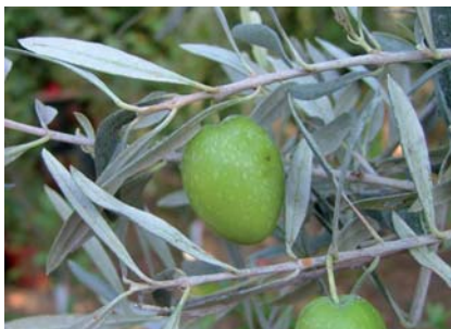
Olive dell'esemplare ultracentenario di Tabiano (M. Carboni)