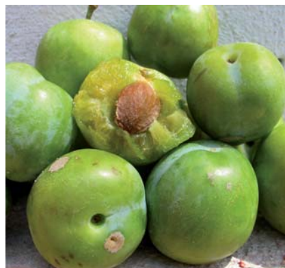
Campioni di Susino Gabbaladro in piena maturazione e con buccia verdastra (N. Biscotti)

Tradizione orale, testimonianze scritte, (Biscotti N., I frutti antichi del Gargano, in corso di stampa). Nessuna attenzione di tutela.