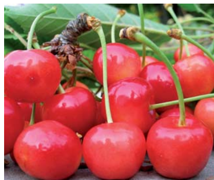
Campioni di Ciliegia della Marina raccolti nel territorio di Carpino (N. Biscotti)

Tradizione orale. Nessuna attenzione di tutela.