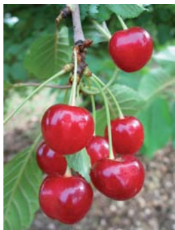
La Ciliegia della Marina in piena maturazione, nella sua forma più tipica (agro di Vico del Gargano (N. Biscotti))