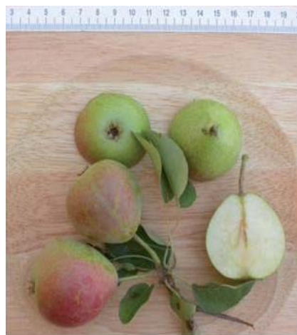
Particolari pomologici della Pera Zammarrino (F. Minonne)

Tradizione orale. Rilievi ed osservazioni pomologiche sono state fatte nell'ambito di una tesi di Dottorato (Minonne, 2008). Non è riportata dagli autori pugliesi che si sono occupati di questa specie (Donno 1959; Reina 1974; Ferrara 1970).