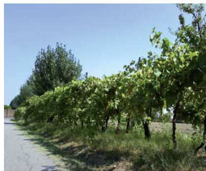
Filare di viti centenarie di Uva Morta (S. Guidi)

Questo vitigno era diffuso in passato nella pianura romagnola. Il suo nome deriva dal suo colore che non è né giallo, né rosso, ma marrone, il colore della morte appunto.