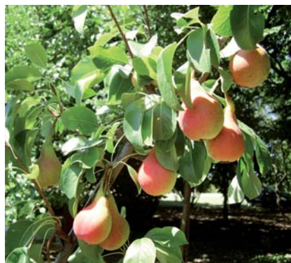
Ramo con Pere Rampine (S. Guidi)

Questo frutto tradizionale della pianura emiliana e romagnola è conosciuto anche come Pera San Pietro e nel dialetto romagnolo viene chiamato anche "Pera Zaclèna". Matura nella prima decade di luglio.