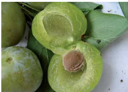
La caratteristica polpa completamente spiccagnola del Susino Gabbaladro (N. Biscotti)