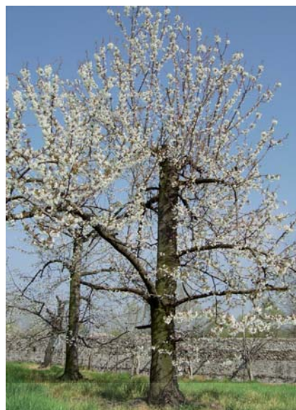
Ciliegio Morettina di Vignola in fioritura (S. Guidi)

In situ : bassa valle del Panaro, nei comuni di Vignola, Savignano sul Panaro.