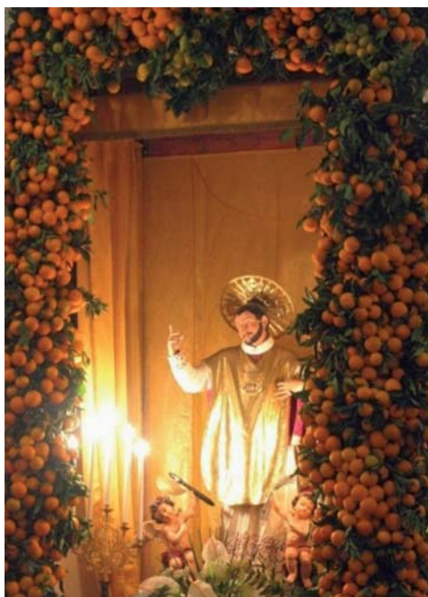
Foto 25: San Valentino adornato di arance nei giorni dei festeggiamenti a Vico del Gargano

De Cesare, 1853). Il Tavoliere delle Puglie è la zona più arida d'Italia, arsa dal sole di giorno e fredda di notte; 400 mm di pioggia appena l'anno. Ma non è stata la scarsità di pioggia a segnare il suo destino: basta guardare una cartina topografica o geografica per sorprendersi della presenza di un intricato reticolo idrografico, con resti di paludi. Prima della conquista romana lussureggiava di verde, di boschi planiziali; i Romani, per conquistarla, la misero a ferro e fuoco e la trasformarono sin da allora in un immenso pascolo.