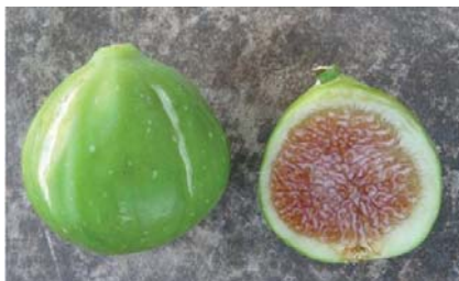
Particolari pomologici del fornito Fasanese (P. Belloni)