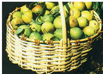
Pera Cocomerina precoce a maturazione (S. Guidi)

In situ : aziende agricole di Verghereto e Bagno di Romagna, Ex situ : giardino della biodiversità di Cesenatico.