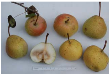
Frutti maturi di Pera delle Garapine (A. Montecchi)