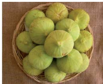
Fico Abate maturo

(Minonne, 2008). La sua maturazione tardiva l'ha forse esclusa dal mercato del prodotto fresco da sempre orientato ai fioroni e per giunta di varietà precoci; meriterebbe quindi interventi mirati di valorizzazione.