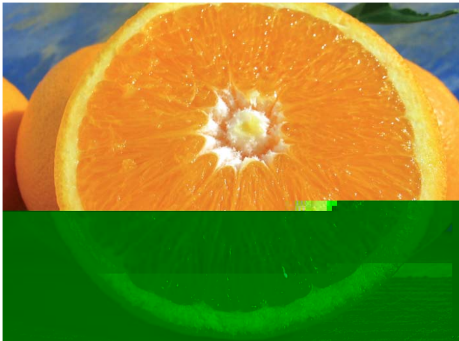
Foto 27: Duretta del Gargano (Biscotti, 2007). Varietà esclusiva degli agrumeti storici del Gargano, inseriti di recente negli agrumeti storici italiani (Senato della Repubblica) e nel catalogo dei paesaggi agrari storici del MiPAAF (N. Biscotti)

Sono questi i tempi (1850-1920) in cui i paesi del Gargano settentrionale conoscono giorni di prosperità e di benessere; nonostante la limitata superficie di terreno utile (complessivamente circa 1000 ha) il Gargano si colloca, a livello italiano, al terzo posto per la produzione di agrumi e per le rese unitarie mentre è al primo per i profitti unitari realizzati.