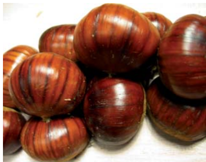
Campioni della Castagna Rigata (N. Biscotti)