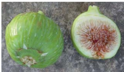
Particolari pomologici del Fico Ficattala (P. Belloni)