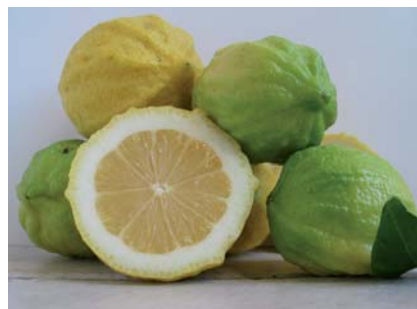
Caratteri interni del Limone Incannellato (N. Biscotti)

Scoperto casualmente nel dicembre 2009 un grande albero di cui non ci è stato possibile ricostruire notizie in merito. Urgono ricerche di campo, per verificare l'esistenza di altri alberi e porne studiare in maniera adeguata tutti gli aspetti pomologici ed agronomici.