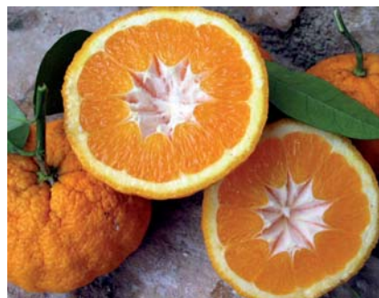
Sezioni trasversali di Arancia Incannellata che evidenziano la colonna carpellare cava e con caratteristico disegno (N. Biscotti)

Tradizione orale attesta un antico legame con gli agrumeti garganici (Biscotti N., I frutti antichi del Gargano, in corso di stampa). Con ogni probabilità sul piano varietale è da attribuire all'Arancia Incannellata, antica varietà di arancio amaro ( Citrus Aurantium Caniculata ) descritto già da Gallesio. Un arancio "Incannellato" si trova nella Limonaia dei Giardini dei Boboli a Firenze. Esistono anche limoni o limoncelle incannellate: ne parla nel 1500 il botanico Della Porta per Sorrento e come tale, Limonier à Fruit Cannelé, sono classificate da Antoine Risso (1818).