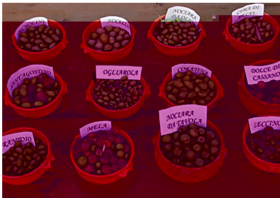
Foto 26: Diversità di olive (Frantoio, Nocella, Nocciara, Leccino, Ogliarola, Dolce di Cassano, Mela) nel brindisino (Masseria "Il Frantoio", Ostuni).

agrumi, pero, mandorlo, vite, olivo, sono state invece gradualmente sostituite dalle cosiddette nuove varietà. In entrambi i casi si è assistito al progressivo impoverimento intraspecifico del patrimonio varietale tradizionale che si è prodotto in ogni contesto agricolo, dal Gargano al Salento. Quanto ampia sia la diversità persa non è dato sapere con numeri attendibili e anche la stessa documentazione bibliografica è settoriale e limitata per quanto preziosa. In bibliografia si trovano diversi autori ma le loro testimonianze sono relative ad alcune aree o solo per alcune colture. Si hanno lavori datati e generali per il mandorlo (Pantanelli, 1936), per la vite (Froio, 1875); altri, invece, sono relativi ad alcune specie e a precisi distretti agricoli, come il Salento (Minonne et al., 2002).