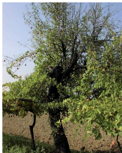
Il pero come tutore vivo nei filari di viti

Antica cultivar di origine ignota. Il pero era coltivato già dai Romani nel territorio emiliano romagnolo, in particolare nell'area della centuriazione, dove i legionari a riposo coltivavano frutti, cereali e vite, come viene descritto da Columella nei suoi testi.