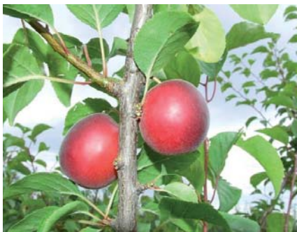
Frutti di Biricoccolo a luglio (D. Ghetti)