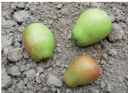
Frutti della cultivar Pum Salam (S. Guidi)