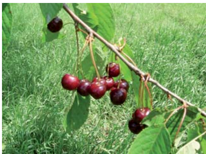
Ciliegia Morettina a completa maturazione (S. Guidi)