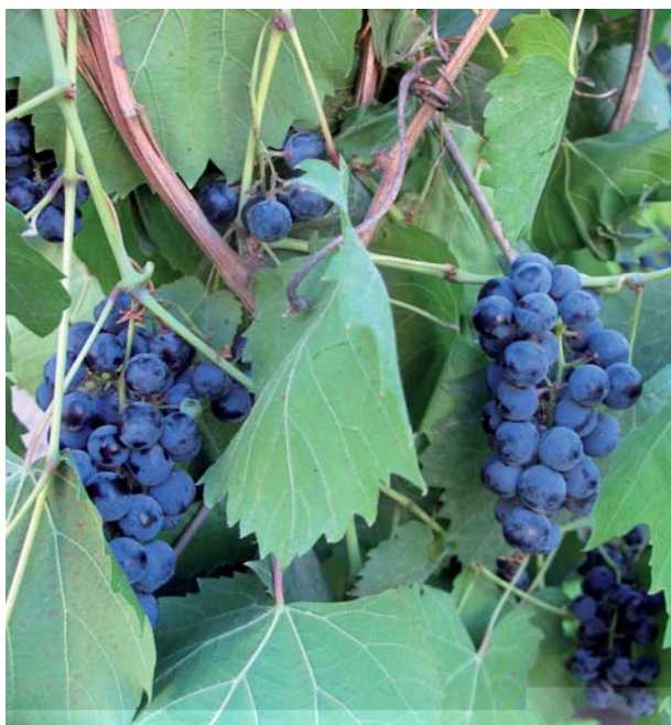
Foto 20: Particolari grappoli e foglie di Vitis vinifera sylvestris