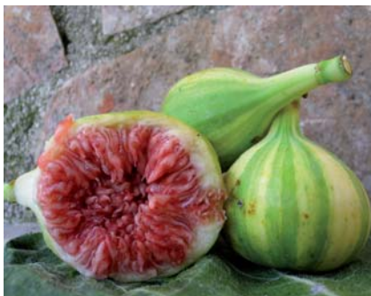
Reperto garganico di Fico Rigato, tendenzialmente piriforme (N. Biscotti)