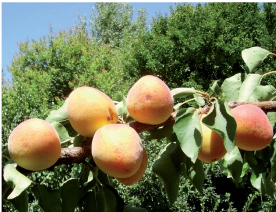
Foto 23: L'albicocco, frutto caratteristico della Romagna

L'albicocca è un frutto che arriva dalla lontana Cina, in cui era conosciuta già quattromila anni fa. Attraverso il Medio Oriente giunse fino al bacino del Mediterraneo. In Emilia-Romagna l'area interessata alla produzione comprende il comprensorio imolese e la Valle del Santerno e copre una superficie di circa 1390 ettari, per una produzione che si aggira sulle 16.000 tonnellate annue. L'albicocca Val Santerno d'Imola si coltiva dal fondovalle a un'altitudine di circa 350 m s.l.m. A testimonianza di quanto sia radicata questa coltura in Romagna, si ricorda che il primo impianto intensivo risale al 1870 e si trovava nel podere Vallette di Pieve Sant'Andrea, nel comune di Casalfiumanese. Dal punto di vista climatico, tale zona presenta condizioni ottimali nelle fasi critiche di crescita e maturazione del frutto: le estati sono calde e gli inverni rigidi, le precipitazioni sono prevalenti in autunno e minime in estate. La scarsa presenza di gelate primaverili tardive permette di evitare danni ai fiori o ai frutti.