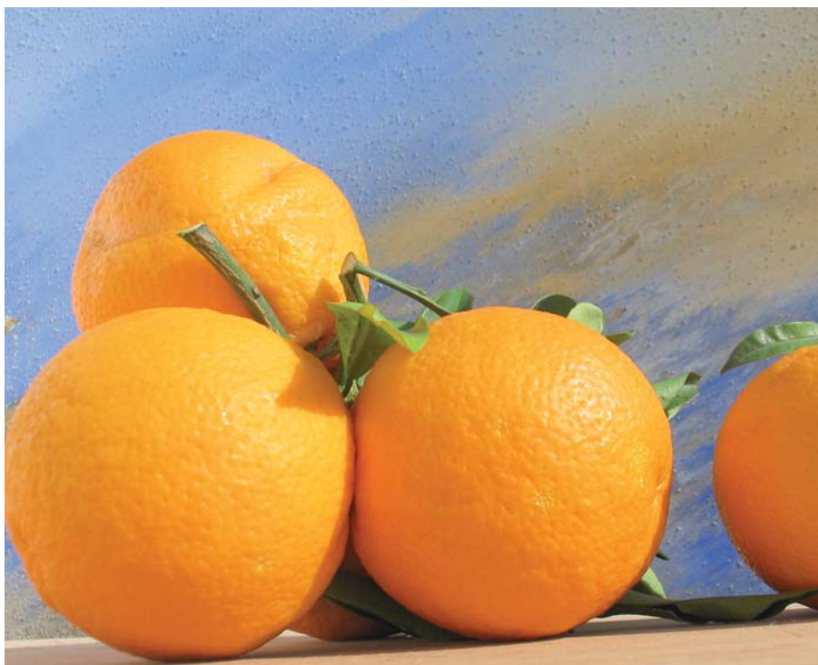
Foto 17: Arancia Squacciata , ecotipo garganico di Biondo Comune (N. Biscotti)