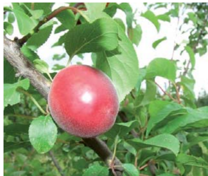
Frutto di Biricoccolo a maturazione (D. Ghetti)