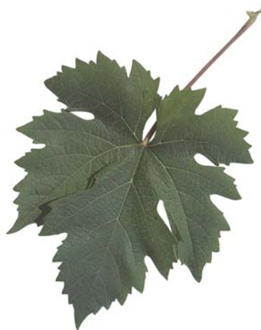
Vite centenaria di Rotaglia (S. Guidi)

Viene ricordato da De Bosis F. nei Bollettini Ampelografici del 1879 fra le uve bianche del circondario di Rimini. Sembra essere un vitigno tipicamente riminese, non presente nel forlivese e cesenate. Gli anziani viticoltori ricordano che il Verdetto, per il suo colore verdognolo anche a maturazione, veniva piantato nei filari più lontani da casa in quanto, per questa sua caratteristica, non veniva rubato all'epoca della vendemmia in quanto ritenuto immaturo.