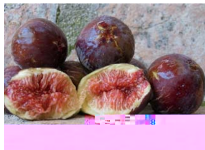
Caratteri della polpa del Fico Dottato Nero (N.Biscotti)

Scoperto nel 2005 casualmente un vecchio albero, poi morto (Biscotti) lungo il letto di un torrente. Urgono ricerche di campo, per verificare l'esistenza di altri alberi e porne studiare in maniera adeguata tutti gli aspetti pomologici ed agronomici