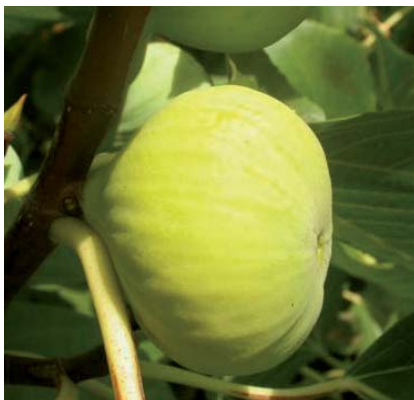
Il Fico Abate in fruttificazione (F. Minonne)