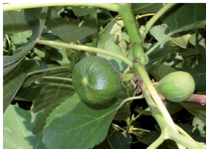
Frutto immaturo del Fico di Cavana (S. Guidi)